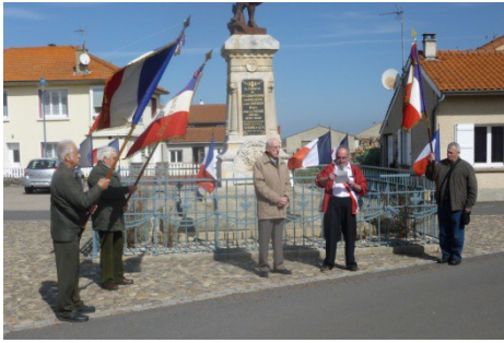
Commémoration à St-Christophe