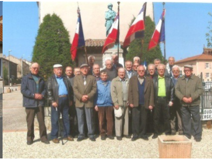
Commémoration à Bains